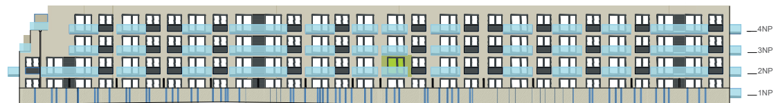
Jižní pohled na dům / Building View - south side